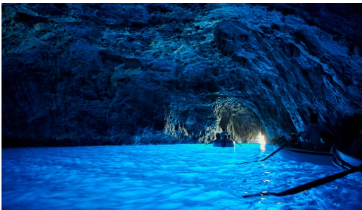
Die Blaue Grotte, Capri und die Faraglioni...