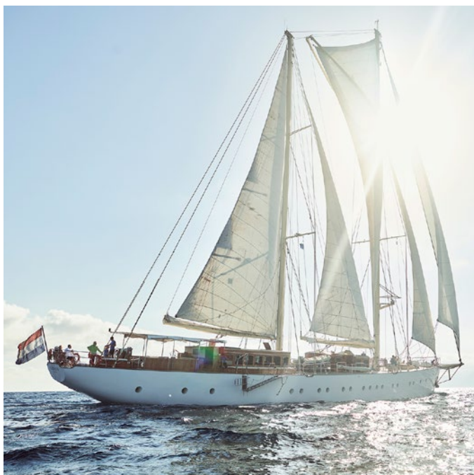
SY CHRONOS – 54 m, 1.000 m 2 Segelfläche

Das besondere Erlebnis an Bord unserer Schiffe ist die Mischung aus entspanntem Segeln mit Zeit zum Baden, für Landausflüge und Erholung. Die folgende Beispielroute beschreibt, wie eine Reise an Bord ablaufen könnte. Der Kapitän wird bei jedem Törn das bestmögliche Routing passend zu den aktuellen Wind- und Wetterbedingungen für Sie auswählen. Genießen Sie die Freiheit der Meere ohne den Zwang eines fixen Routings.