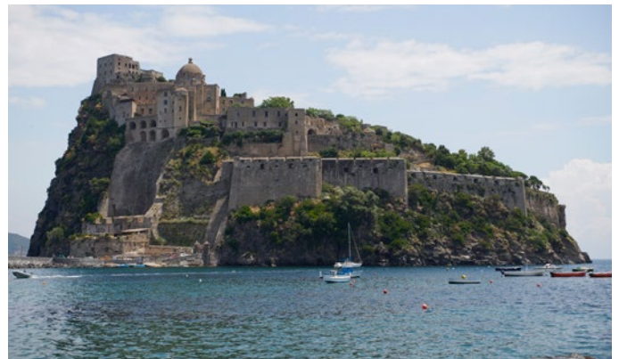
Das Castello Aragoneso, Ischia

Im Golf von Neapel segelt die CHRONOS weiter nach Ischia . Zeit, den Aufenthalt auf der großen Decksfläche aus Teakholz, die vorbeiziehende Landschaft und die Entspannung an Bord zu genießen. Meist ankert die CHRONOS vor dem Castello Aragoneso, einer eindrucksvollen mittelalterlichen Festung, die durch eine Steinbrücke mit Ischia verbunden ist. Sie war 300 Jahre lang Hauptstadt der Insel, ein sehr lohnender Abstecher. Ischia selbst ist für seine mineralhaltigen Thermalquellen und schönen Strände im Süden der Insel bekannt. Procida , die kleine Nachbarinsel Ischias, ist immer noch ein Geheimtipp. CHRONOS ankert vor dem Fischerdörfchen Corricella, einem malerischen Ort mit pastellfarbenen Häusern und im Wasser tanzenden Fischerbooten. Teile des Films ‚Il Postino‘ wurden hier gedreht. Vielleicht wird heute das Abendessen an Land auf der Mole in einem der hervorragenden Restaurants serviert. Genießen Sie