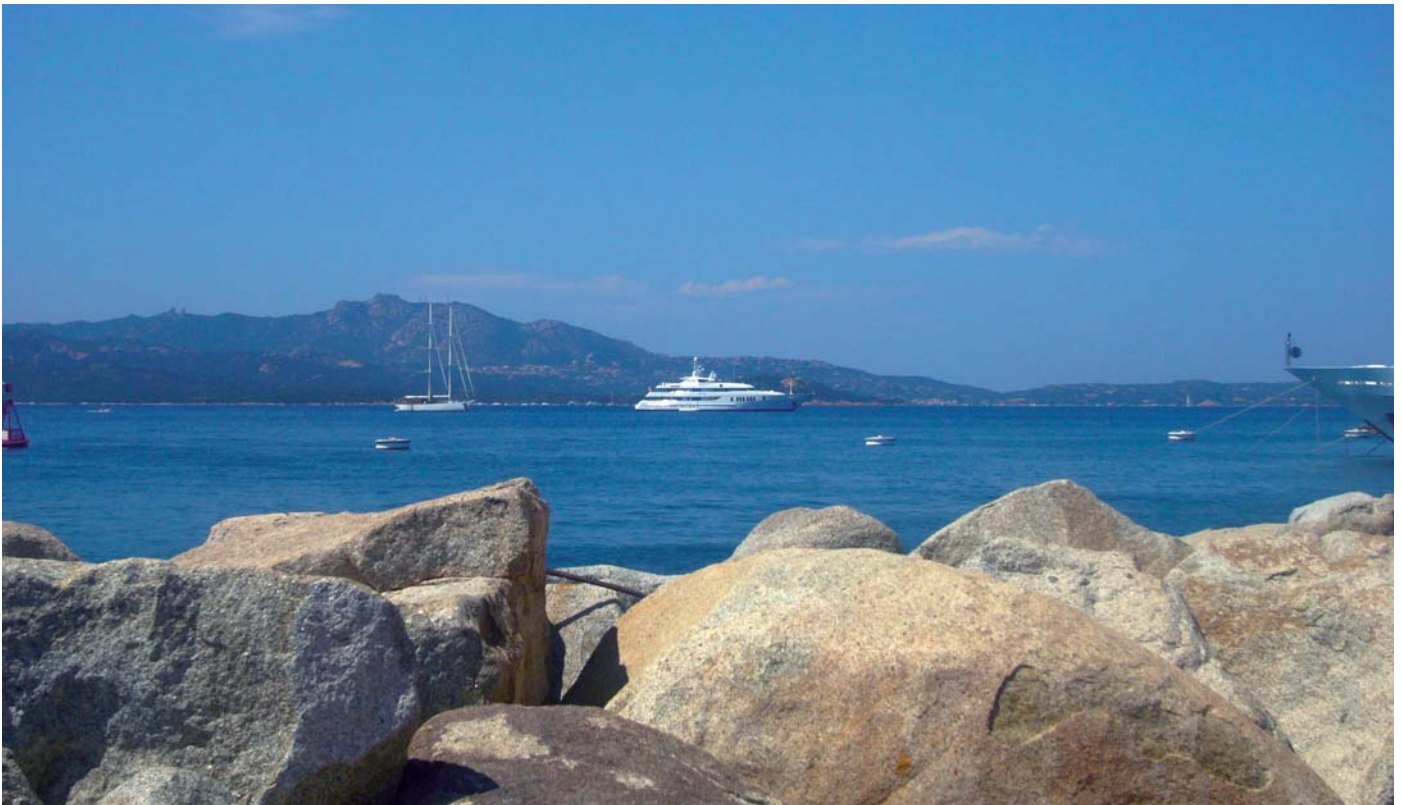
Kairós vor Anker in der Cala di Volpe