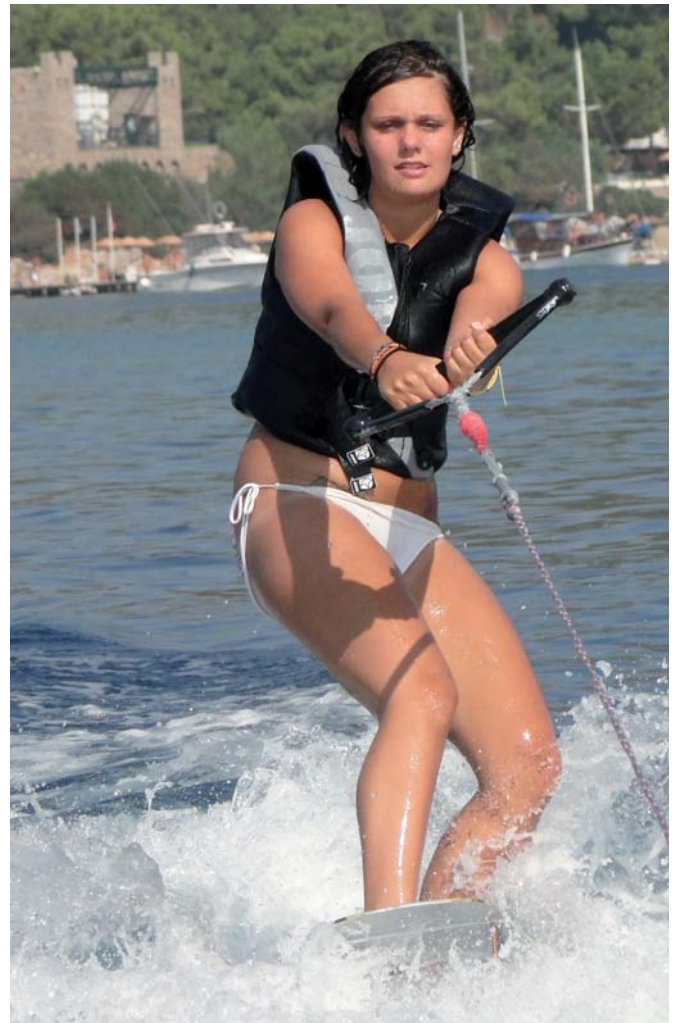
oder sportliches Wakeboard

Nach zwei Stunden Bummel durch diesen wunderschönen, mondänen Hafen laufen wir wieder aus und setzen Segel vorbei an Capo Ferro und weiter Richtung Norden. Unter den Mitseglern, die alle auf Deck sitzend oder liegend über die „Wellen“ schauen, gibt es eine angeregte Diskussion über den in Porto Cervo zur Schau gestellten Reichtum. Ein Paar hat für zwei Cappuccino und zwei Dolce im Yacht Club über € 30,- bezahlt. Wir waren dafür in der Clipper Bar mitten im Ort und der Espresso hat wie fast überall in Italien € 1,- gekostet.