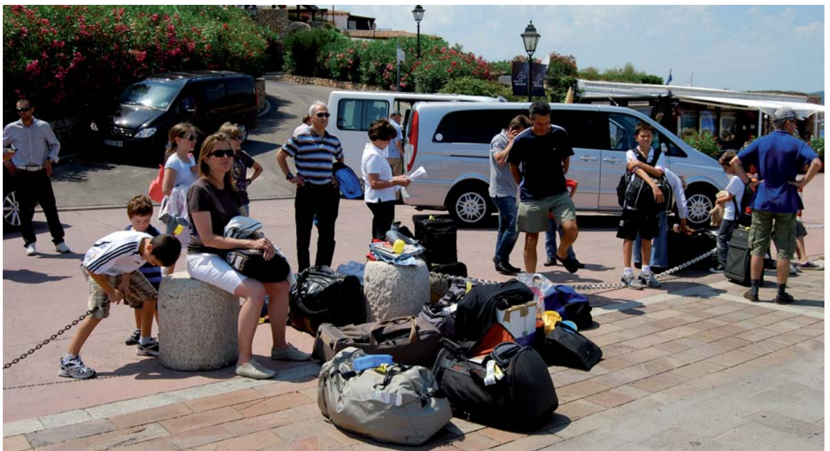
Ankunft in Olbia