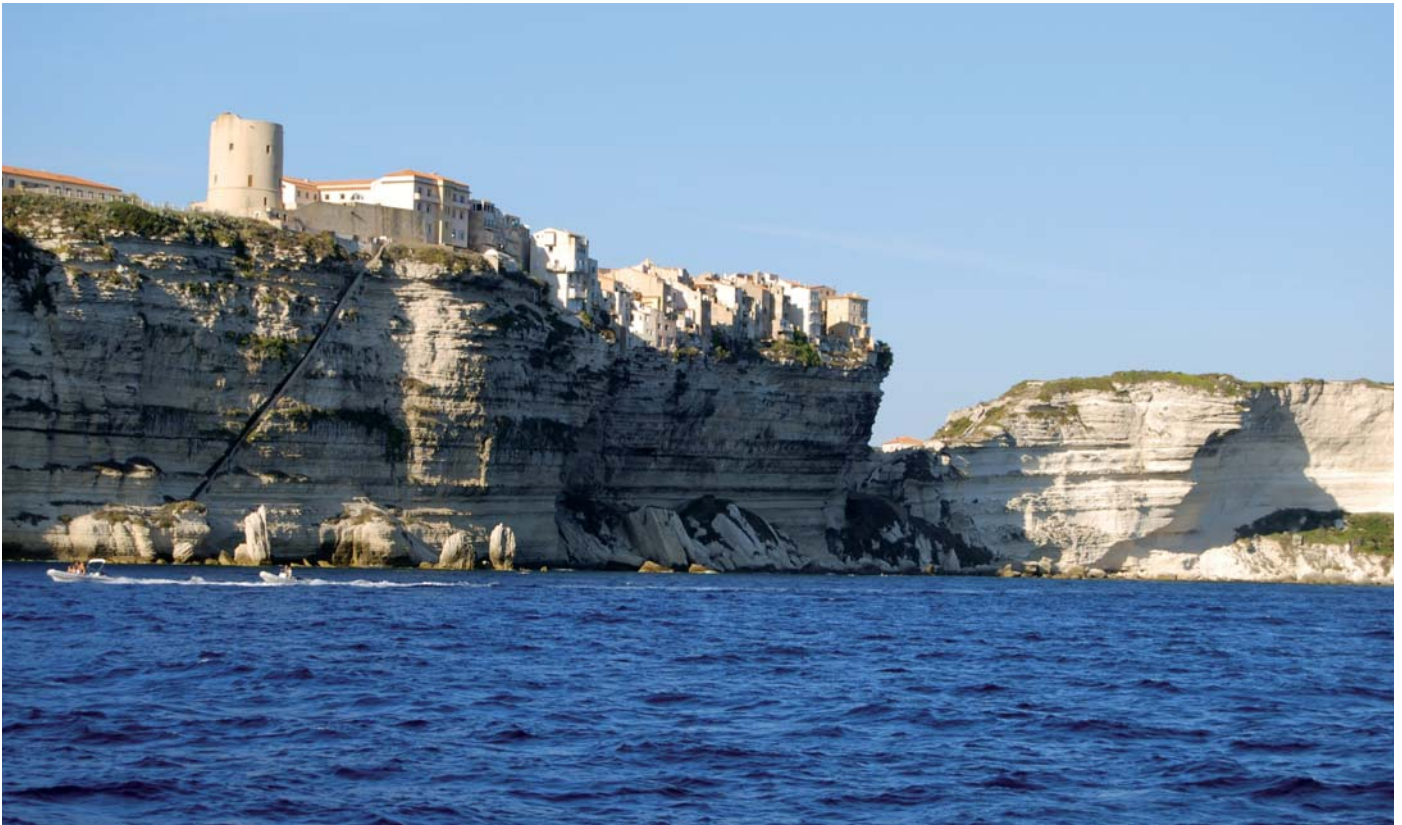
Kreidefelsen und Oberstadt von Bonifacio