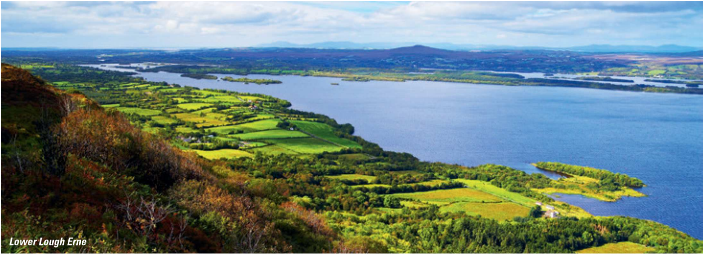
Lower Lough Erne